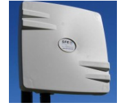
Faisceau 5 GHz