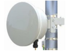
Faisceau 24 GHz

Alimentation POE 10 à 28V - Fourni avec bloc injecteur secteur ou bloc secteur + injecteur suivant modèles - Option AF/AT pour compatibilité switch POE 802.3AF/AT