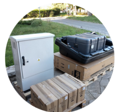
Kit solaire au sol